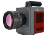
冷却式サーモグラフィー