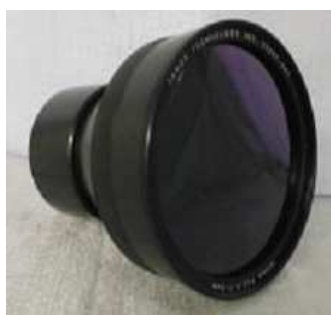
赤外ブロードバンド・レンズ