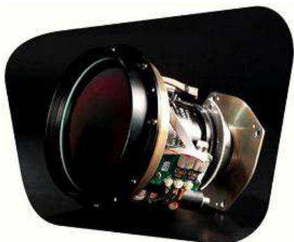
遠赤外CPU制御レンズ